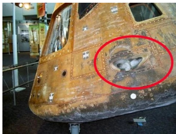
Figure 1: Capsule Apollo après sa rentrée

Là encore, le concept de véhicule hypersonique manœuvrable n'est pas nouveau, et pas seulement dans les applications militaires : il a notamment été mis en œuvre dans les années 1960 sur les capsules Apollo. Et même mieux : sans ces manœuvres, le retour de la Lune aurait vraisemblablement été impossible. La rentrée des capsules Apollo se fait en effet à une vitesse de l'ordre de 11 000 m/s (Mach > 30). Une rentrée directe dans l'atmosphère se terminerait soit par de trop fortes décélérations pour l'équipage (ou des flux thermiques trop importants pour la capsule) si la pente de la trajectoire était trop forte, soit par la perte de la capsule qui ressortirait de l'atmosphère sans espoir de retour si cette pente était trop faible. Les manœuvres permettent de créer un étroit couloir de rentrée (autour de 6 degrés de pente) réduisant ces risques.